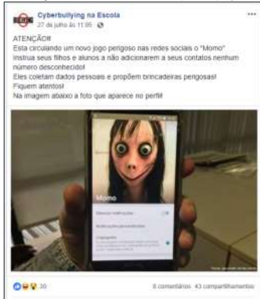
Figura 1: Recorte com ênfase no cyberbullying .