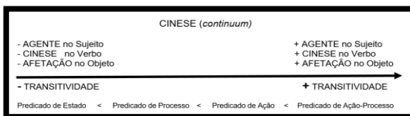
Figura 02: Traço/Parâmetro Chinês (continuum).