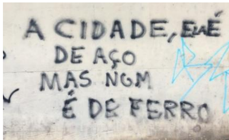
Figura 3: Pichação em referência à “cidade do aço”, alcunha de Volta Redonda.

Nessa apropriação de espaço, a pichação excede o limite de um simples ato de rebeldia para constituir uma ação de poder em resposta a imposição de outro poder. Retomando Foucault (1985), o poder não é um lugar social de dominação ou questão de superioridade hierárquica que se estabelece sobre seres passivos, é antes fruto de uma tensão exercida entre os sujeitos, numa relação fluante. Assim, ao passo em que uma imposição é feita, uma reação contrária é desencadeada, de tal forma que se torna preciso que o poder seja revisto para tentar ser restabelecido, logo, ocasiona-se um jogo de enfrentamentos no qual o discurso se estabelece como mecanismo utilizado para que o poder funcione