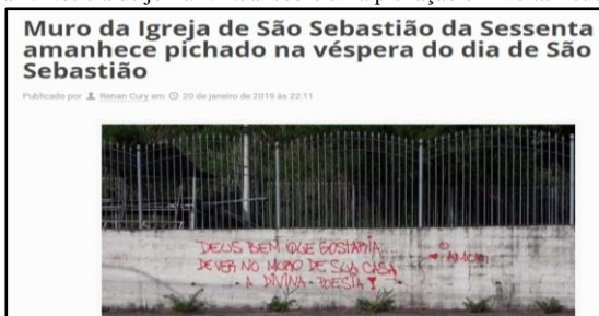
Figura 2: Notícia de jornal virtual sobre uma pichação em Volta Redonda.

Fonte: disponível https://www.informacidade.com.br/muro-da-igreja-de-sao-sebastiao-da-sessenta-amanhece-pichado-na-vespera-do-dia-de-sao-sebastiao/ . Acesso em: 10 de out. de 2020.