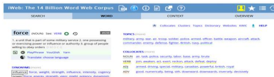
Imagem 2: Descrição de force no iWeb Corpus .

Ao buscarmos force (enquanto substantivo) no iWeb Corpus 5 , disponível a partir da plataforma do COCA, percebemos que as definições dadas são referentes a: 1) uma unidade que é parte de algum serviço militar. 2) alguém que tenha ou exerça poder ou influência ou autoridade. 3) grupo de pessoas propensas a obedecer ordens. É notório que não há, dentre as entradas lexicais, a relação da palavra com o sentido de apoio ou suporte, mas sim, associada às Forças Armadas, serviço e autoridade militar. Vejamos na imagem a seguir, informações detalhadas sobre a palavra: