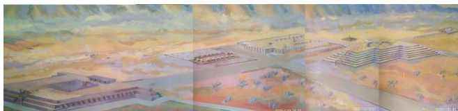
Figura 7: foto montada a partir do painel do Museu Tiwanaku de como seria a cidade em seu apogeu.