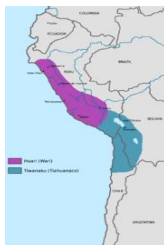
Figura 1: Mapa de domínio da cultura tiwanaku.