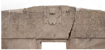
Figura 14: exemplo de Narrativa Temática no frontispício da Porta do Sol

O grau de conhecimento alcançado pela cultura tiwanaku se evidencia com precisão matemática e marcam os solstícios e os equinócios. Por exemplo, no dia 21 de março, o equinócio de outono, o astro rei nasce exatamente pelo vão de entrada de Templo de Kalasasaya; o dia 21 de junho, o solstício de inverno, o sol nasce pelo ângulo formado pelos muros leste e norte, em relação ao ponto central junto ao muro oeste; o dia 21 de setembro, equinócio da primavera, o sol nasce pelo ângulo do muro leste-sul, em relação ao ponto central do muro oeste; o dia 21 de dezembro, solstício de verão, o sol novamente nasce pela parte central de ingresso ao templo.