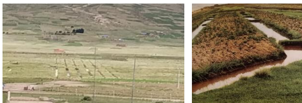
Figura 4 e 5: Sistema “sukakollu” (montes de cultivo).