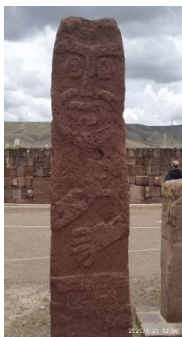
Figura 16: Monólito “homem barbado”.