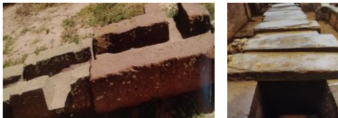
Figura 6: aquedutos para captação das águas das chuvas.