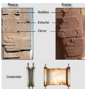
Figura 20: detalhes do monólito Ponce e Fraile apresentando as aglomerações de signos.

Esses monólitos presentes na capital do grande império Tiwanaku tem seus corpos cobertos de signos dispostos de tal modo a serem interpretados pelos estudiosos como um verdadeiro sistema de escrita desde os sinais primários até as narrativas temáticas “lidas” como a totalidade do monólito.