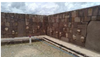
Figura 15: Pode-se perceber a profundidade do templo e o sistema de escoamento de água.