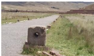
Figura 13: amplificador sonoro.