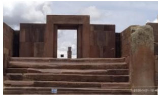
Figura 12: Entrada principal do templo.