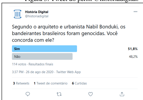
Figura 3: Tweet do perfil @historiadigital.

Isso posto, vejamos nossa primeira figura, a qual registra um tweet publicado em um perfil didático que aborda temas históricos: