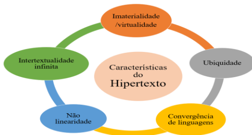
Figura 2: Características do hipertexto, segundo Xavier (2015).