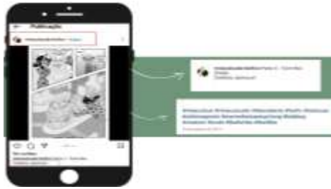
Figura 3: Interface da publicação no Instagram .