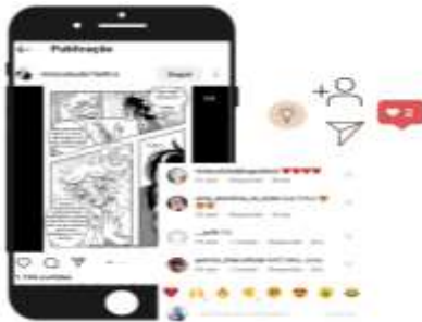
Figura 4: Aportes signos dispostos no layout da página miraculousbr.fanfics .

É notório, ainda, que as publicações dessa rede social sejam feitas sempre mediante arquivos de imagens e vídeos. Não é possível que o usuário realize uma publicação sem ao menos a inserção de uma imagem ou um vídeo, aspecto que se relaciona com a característica multissemiótica, muito presente nas composições publicadas no Instagram . A multissemiose, em consonância com Koch (2007), faz parte das características atribuídas ao hipertexto e pode ser ilustrada com a figura 4, a seguir: