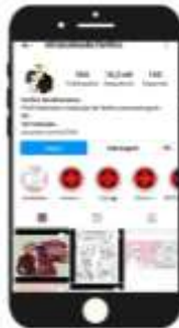
Figura 1: Interface inicial do perfil @miraculousbr.fanfics.