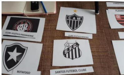
Figura 2: Passo 3 Associação entre o nome e a imagem.