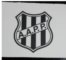
Figura 1: Exposição da temática do atendimento.