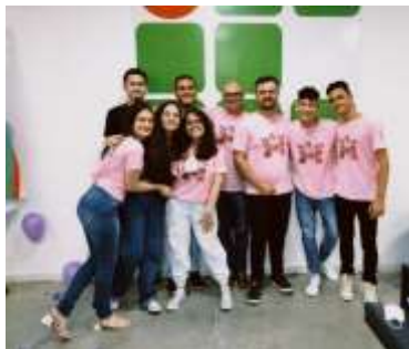
Figura 1: Fotos do Letras no sertão.

alagoano, com isso observa-se a necessidade e a importância de lidar com as diferentes vivências e perspectivas de mundo que circulam no espaço em questão. Diante disso, discentes e docentes organizam inúmeros eventos para que assim ocorra a inclusão dos diversos indivíduos ali presentes, um dos eventos mais relevantes e que possui um maior impacto regional oriundo dessa organização é o conhecido “Letras no Sertão”.