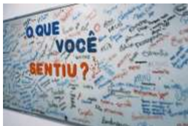
Figura 3: Fotos do Letras no sertão.