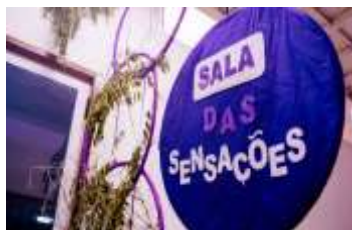
Figura 2: Fotos do Letras no sertão.

tem uma errônea visão desse espaço geográfico, ou seja, há essa quebra da distorção da nossa “casa”.