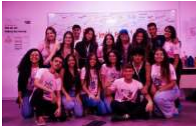
Figura 4: Fotos do Letras no sertão.

Ao decorrer das apresentações, notou-se o quanto realmente fazer o tema era necessário, pois a partir dele foi possível apontar como muitas pessoas invalidam a violência sexual, além de como isso era pouco discutido em sala de aula. Ademais, ocorreram experiências em que os membros não estavam preparados, por exemplo fortes surtos de choro, diante disso sentimos enquanto promotores da sala o quanto aquilo era delicado e o quanto nos afetou. Partindo disso, nota-se a falha por não ter tido uma pós-sala para melhor atender essas pessoas que tiveram maior sensibilização, porém não se descarta que a ativação de gatilhos gera a empatia e fez-nos descobrir alguns casos de abuso sexual, com isso pudemos auxiliar e fornecer a pessoa correta para lidar com isso sem que houvesse exposição da pessoa.