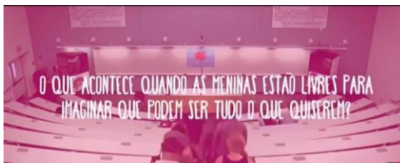
Figura 01: Discurso de abertura do vídeo.

Neste trabalho, interessa-nos analisar o vídeo Imagine the possibilities , cuja duração é de 1 minuto e 40 segundos. O vídeo está disponível na Youtube em várias versões e, dentre elas, escolhemos a versão dublada. Interessa-nos, portanto, discutir como a coleção “Barbie Quero Ser” tenta romper velhos paradigmas quanto às profissões que as mulheres exercem na contemporaneidade, a partir dos discursos no vídeo supracitado. Vejamos, então, as figuras abaixo 154 e suas respectivas análises discursivas: