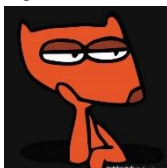
Figura 3: Luciraldo.

Com base nas concepções históricas do “mal” o cartunista Carlos Ruas cria um personagem denominado Luciraldo, uma representação deste “diabo” da cultura popular.