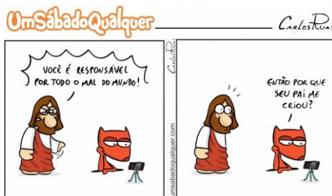
Figura 4: Personificação do Mal.

Esta personificação é imaginada nesta figura diabólica que o cartunista Carlos Ruas, que com maestria, representa em suas tirinhas.