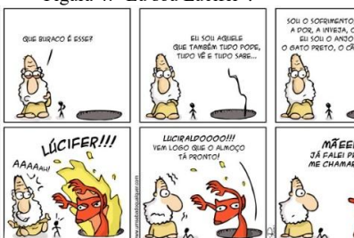
Figura 4: “Eu sou Lúcifer”.

Observamos as mesmas características denominadas na Idade Média: um personagem vermelho, com cifres, com o corpo que possui a metade de um bode e pratica a maldade. Carlos Ruas brinca até com a questão cômica que é representada nos teatros do século XII.