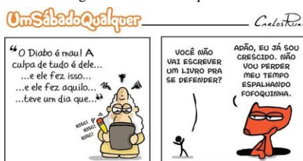
Figura 5: Visão maniqueísta.

Ou seja, uma filosofia que fora construída com base nesta visão limitada, na visão que o ser humano possui apenas “dois caminhos”, não há as concepções criadas na evolução psíquica do homem.