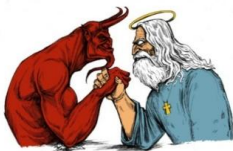
Figura 2: Origem do mal.

Esta ligação que existiam entre a arte, cultura popular e religião começou a preocupar a igreja do período. Pois a arte tinha como papel levar divertimento a população, mas também despertar o pensamento crítico. Com este fortalecimento a igreja começou a se preocupar com esta relação e partir deste momento resolveu sistematizar uma visão sobre as ações diabólicas. Ou seja, personificou o que seria o mal, as ações malignas. Toda esta personificação era pautada na manipulação da população, no poderio que fora desenvolvido com base nas interpretações dos textos bíblicos. A partir de toda esta conceitualização fora criada uma imagem representativa da malignidade.