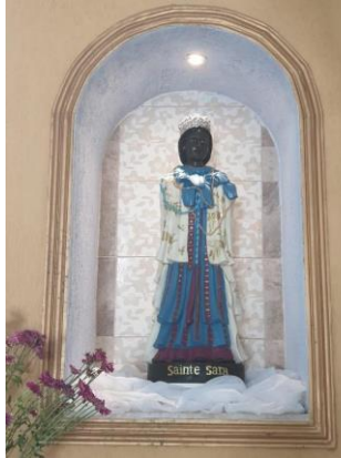
Figura 3: Imagem de Santa Sara em capela de Cabo Frio-RJ.

Fonte: Simone Barretto, em fevereiro de 2020.