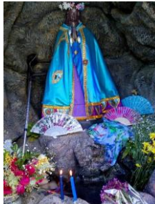
Figura 3: Homenagem à Santa Sara.

Convém ressaltar, que para experimento, o uso de uma oração produzida pelos falantes da língua cigana foi assertivo, por essa ser muito utilizada pelos interlocutores em contextos de intimidade espiritual no dialogar com o Supremo, haja vista a comunicação ser íntima e única. A oração é de autor desconhecido e foi criada em 1712, ano da beatificação de Santa Sara como a única Santa oficial dos ciganos.