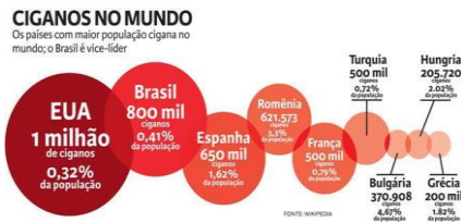
Figura 1: Ciganos no mundo.

No Brasil, os primeiros ciganos chegaram no séc. XVIII, deportados de Portugal, a cabo de duras leis. Desde sua chegada, ocuparam territórios depreciativos, como apontado por Rodrigo Teixeira (2008), áreas abandonadas e insalubres, que, com o passar do tempo, se tornariam um polo de comércio popular. Vale registrar que os ciganos que outrora chegaram depreciados, por meio do seu talento com o ofício do comércio ascenderam socialmente e usufruíram do prestígio da época, frequentando a alta sociedade e foram aceitos até no reinado. Outro ponto relevante a ser citado é o fato de o Brasil ser o segundo país do mundo com o maior número de população cigana em seu território. Ficaram invisíveis e alheios às políticas públicas, além de não serem mencionados na formação do povo brasileiro, sendo omitidos de toda a nossa história, como aponta Teixeira.