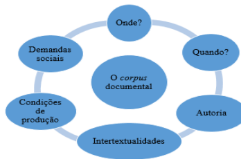
Quadro 1: Esquema de leitura para o corpus .