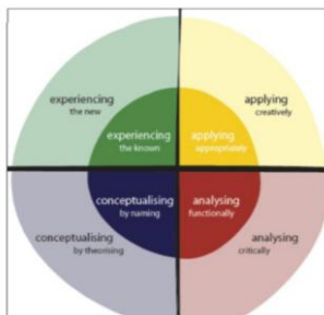
Figura 1: Processos de conhecimentos na pedagogia da aprendizagem pelo design .

res sobre “o que” e “como” ensinam. Essa concepção expande os processos de conhecimento em diferentes experiências de aprendizagem considerando os micro e macro contextos como ilustrado na figura 1.